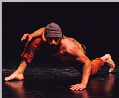
EL PESO DEL ORO